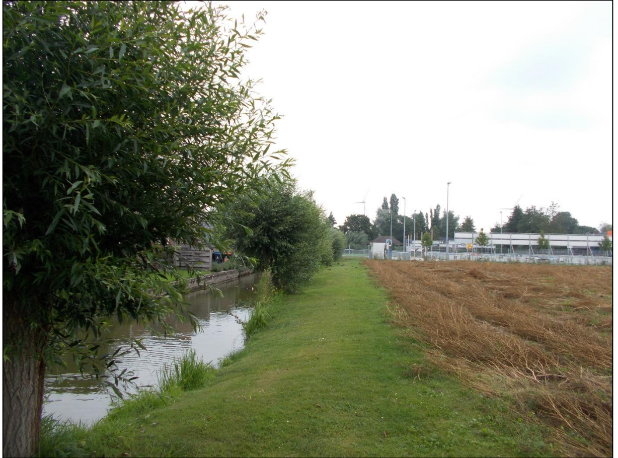
Figuur 3: mogelijkheid tot foerageer- en vliegroutes voor vleermuizen