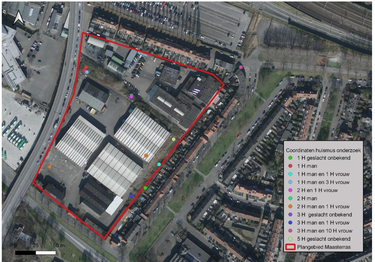
Figuur 3: Huismuswaarnemingen binnen en in de nabije omgeving van het plangebied.